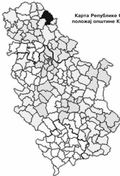
Карта Републике Србије, положај општине Кикинда

У Општини је у службеној употреби српски језик и ћирилично писмо. У Општини је у службеној употреби и мађарски језик и писмо у складу са Законом и Статутом општине у насељеним местима: Банатској Тополи, Кикинди, Руском Селу и Сајану.